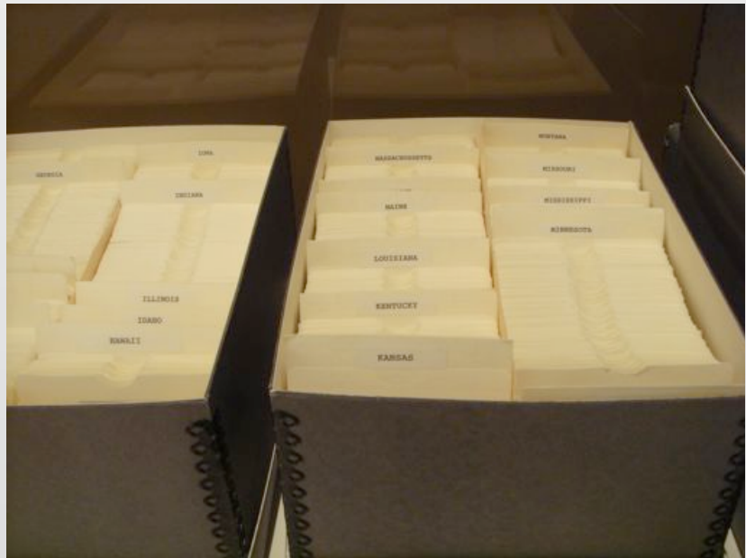
Die Archivbox der Künstlerin.

Das Porträt in der Kunst ist die Darstellung einer oder mehrerer Personen in Form eines Gemäldes , einer Fotografie , einer Plastik oder anderer künstlerischer Ausdrucksformen. Die Funktion des Porträts ist die Darstellung der Persönlichkeit einer Person, die sich im äußeren Erscheinungsbild widerspiegelt: durch Haltung, Gesichtsausdruck, Kleidung, Stellung/Stand, sozialen Status und genetischer Besonderheiten. Typischerweise zeigt das Porträt das Gesicht der Person. Je nach der Anzahl der dargestellten Personen werden Porträts klassifiziert in Einzel-, Doppel- und Gruppenporträts, je nach gewähltem Ausschnitt in Ganzfigur, Amerikanisch, Kniestück, Halbfigur, Bruststück, Büste und Kopfbild. Die Ansicht oder auch die Kopfhaltung der Person werden unterschieden in Frontal (en face), Viertelprofil, Halbprofil, Dreiviertelprofil, Profil (en profile) oder Verlorenes Profil (profil perdu). Das Portrait gibt es aber auch in alltäglichen Verwendungen.