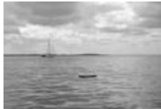
confluence.org: Mecklenburg-Vorpommern: 54 Grad Nord 11 Grad Ost