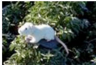
confluence.org: Thüringen: 51 Grad Nord 14 Grad Ost